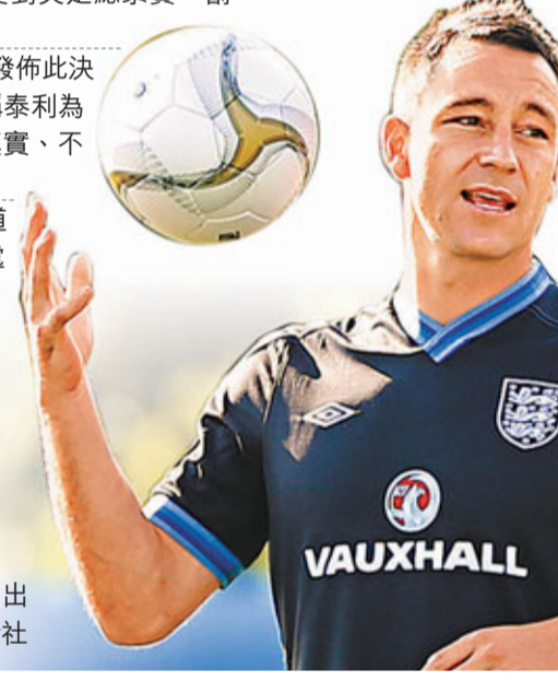
泰利已宣布退出三獅軍團。

車路士隊長泰利的種族歧視風波終於告一段落，雖然地方法庭宣判無罪，但英足總依然認定他有種族歧視的言行，對他施加了4場禁賽和罰款22萬英鎊的處罰。泰利決定不會對足總的指控進行上訴，這樣他的處罰將正式開始生效。據《每日郵報》報道，車路士這次確實下了狠心，他們甚至對泰利發出了最後通牒，只要再有一次類似情況，就將廢除合同，把「藍軍」隊長踢出球隊！該報稱，球會已經對泰利作出了這樣的警告，而泰利也接受了，在與高層的一次會面中，泰利被當面告知，他在球會的未來取決於以後的行為舉止。