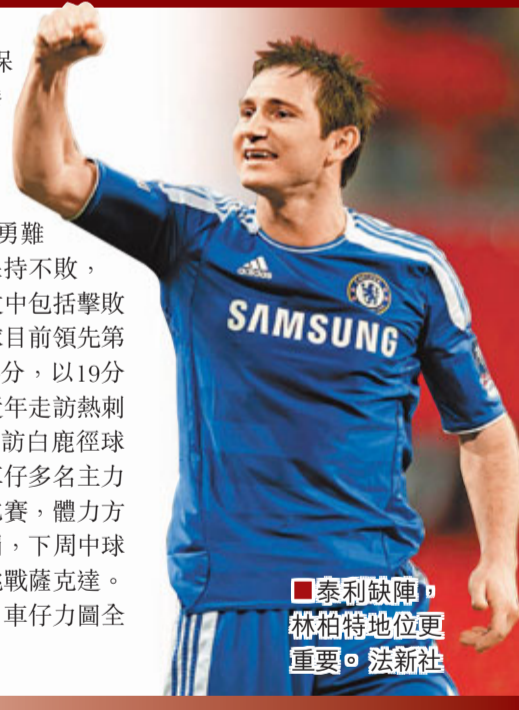
泰利缺陣，林柏特地位更重要。

車路士(車仔)今季聯賽表現神勇難擋，他們在聯賽7輪過後不僅保持不敗，而且更是贏足6場，而這6場勝仗中包括擊敗紐卡素和阿仙奴此等勁旅，球隊目前領先第二位的曼聯和第三位曼城多達4分，以19分领跑英超積分榜。不過，車仔近年走訪熱刺的戰績並不理想，球隊近3次走訪白鹿徑球場僅取得2和1負的戰績。而且車仔多名主力球員在周中均參與了國家隊的比赛，體力方面的損耗較大，隊長泰利被處罰，下周中球隊在歐聯分組賽要遠赴烏克蘭挑戰薩克達。今仗作客挑戰近況最佳的熱刺，車仔力圖全身而退。