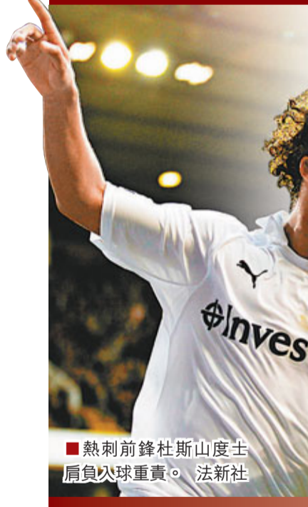
熱刺前鋒杜斯度士肩負以球重責。

香港文匯報訊 本港時間今晚7時45分上演倫敦打吡，熱刺在主场迎戰車路士。(有線200、300、204台直播) 雖然熱刺在聯賽開賽階段的表現較為慘淡，但是球隊在領隊波亞斯的帶領下迅速反彈，不但在聯賽中作客以3:2擊敗曼聯，並且在上輪擊敗阿士東維拉後取得聯賽4連勝，目前狀態十分出色。熱刺近期進攻表現極出色，近4輪聯賽一共攻入10球，其進攻組合合作漸成熟，熱刺今季聯賽主场至今取得2勝2和的不敗戰績，其主场戰鬥力不容忽視。即使此番主场面對實力強悍的車仔，熱刺亦有力立於