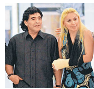
馬拉當拿與女友維羅妮卡。

阿根廷《紀事報》獨家披露，馬拉當拿突然拋棄了已經懷孕4個月的女友維羅妮卡，逃到迪拜去了。阿根廷多家媒體對此消息進行了轉載，不少人批評馬拉當拿無情無義。稍後，維羅妮卡的律師站出來，否認了老馬拋棄維羅妮卡的傳言，但承認，老馬的家人在給老馬施加壓力，讓他「拋妻棄子」。而這背後，涉及的是巨大的利益之爭，據悉，老馬目前擁有600萬美元