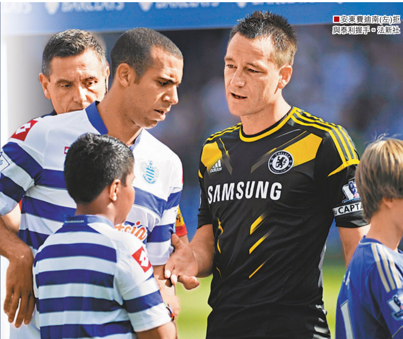
安東費迪南(左)拒與泰利握手。