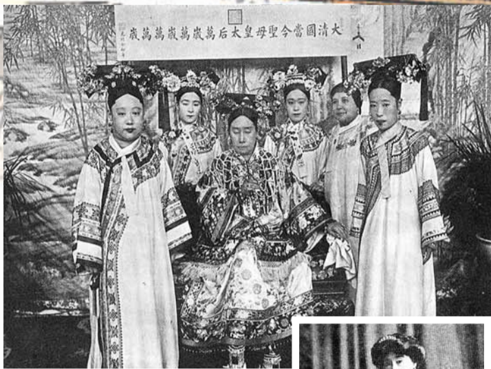
■左起：瑾妃、德齡、慈禧太后、容齡、容齡之母、隆裕皇后。

美籍滿族女作家德齡著有《瀛台泣血記》、《御香縹緲錄》、《清宮二年記》等書。國內外有許多讀者以為這幾本書是可靠作為史料參考的回憶錄。1980年及1981年雲南人民出版社重新印行了前兩本書。在《瀛台泣血記》的重印說明中有這樣的介紹：「她在書中所寫的，多係其親身經歷的生活，可供讀者了解晚清王朝統治者的宮廷內幕和研究晚清歷史作參考……限於作者的出身經歷和當時的歷史條件，書中的寫人敘事存在不少問題，有的觀點顯然是錯誤的，希讀者分析批判地閱讀。」傳世的史書和史料存在着觀點問題是不足為奇的。問題在於《瀛台泣血記》、《御香縹緲錄》的實質是小說，卻以親身經歷的姿態出現，一般讀者可能會認為書中所敘述的處處都是事實，其實不然！