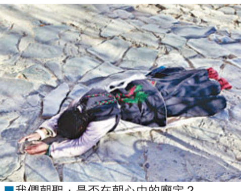
■我們朝聖，是否在朝心中的廟宇？

一切就如旅遊書看的那樣。只是，這個時候，我最害怕的感覺出現了——不外如是。不知道為什麼，一些世界著名的名勝，當你親身看見的時候，會產生不外如是的感觉。當然不是每一個名勝都是這樣，也許只是我個人的感覺也說不定。事實上，被西方譽為聖母峰、玉女峰等的珠穆朗瑪峰，在西藏人眼中也不是最神聖的。西藏的神山叫岡仁波齊，在離拉薩兩千多公里外的阿里地區，而「珠穆朗瑪」，藏語的意思就只是——牛皮。牛皮？啊，真的很像牛皮，披金光的牛皮。西藏人喜歡把山河大地看成是生物。聖湖叫羊湖，珠峰是牛皮，雅魯藏布江是神牛鼻孔噴出來的一道呼吸。