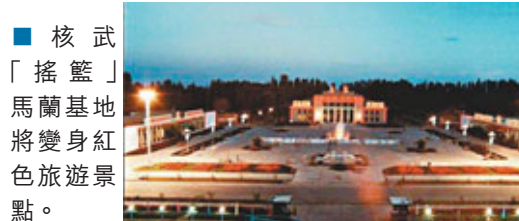
核武「搖籃」馬蘭基地將變身紅色旅遊景點。網上圖片

香港文匯報訊(記者 趙會芳 新疆報道) 被稱為中國核武器「搖籃」的新疆馬蘭,昔日因核試驗基地的身份而披上神秘光環,日前經過國家批准,巴音郭楞蒙古自治州將投資600多萬元建設「馬蘭軍博園」紅色旅遊項目,屆時,核武器試驗場地將變身為時下熱門的紅色旅遊勝地。