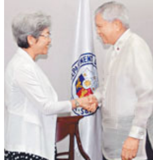
中國副外長傅瑩19日與菲律賓外交部長德爾羅薩里奧(右)會面。

接受記者採訪時說,雙方認為,中菲互為重要鄰國,兩國友好交往源遠流長,加強中菲友好合作符合兩國根本和長遠利益,也是兩國政府和人民的共同願望。雙方同意將按照兩國領導人曾達成的共識,積極開展各層次交往,推進中菲在經貿、科技、執法、人文等領域的交流合作,實施好「2012-2013中菲友好交流年」框架下的交流項目,共同推動兩國關係健康穩定向前發展。