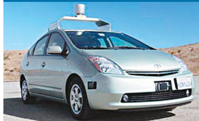
中國自主研發的無人駕駛汽車明年將進行從北京至天津的長途路試。圖為谷歌研發的無人駕駛車。

香港文匯報訊 據新華網報道,18日從中國國家自然科學基金委員會舉行的發佈會上獲悉,中國自主研發的無人駕駛汽車明年將進行從北京至天津的長途路試,2015年將測試從北京駛至深圳。