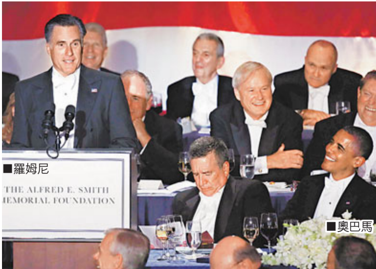
羅姆尼(左)和奧巴馬(右)在晚宴上對峙。

美國總統奧巴馬和共和黨總統候選人羅姆尼周二在辯論中火花四濺，兩人昨晚在紐約出席史密森基金會慈善晚宴時敵意明顯收斂，但仍不忘以玩笑和自嘲互相揶揄。 羅姆尼當晚甫發言便拿自己家境富裕開玩笑，對着盛裝賓客稱，能穿「日常便服」赴宴令自己和妻子感到放鬆。他又笑稱自己和奧巴馬都有值得依賴的重要人物：「我有漂亮妻子，他有克林頓。」 羅姆尼當晚甫發言便拿自己家境富裕開玩笑，對着盛裝賓客稱，能穿「日常便服」赴宴令自己和妻子感到放鬆。他又笑稱自己和奧巴馬都有值得依賴的重要人物：「我有漂亮妻子，他有克林頓。」