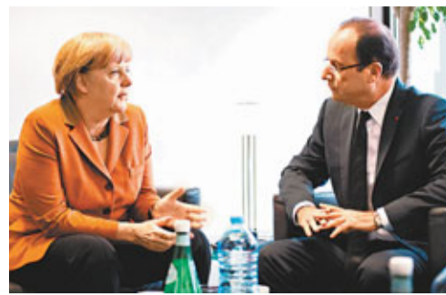
默克爾(左)和奧朗德會前舉行雙邊會談。

德國總理默克爾借用歐央行行長德拉吉的話，指建立銀行業監管不會在一兩個月內完成，須名符其實，才能爭取市場認同，她預計機制明年內開始運作。然而她表示，ESM只會向未來出現財困的銀行注資，並稱「希望到時西銀問題已解決」。分析指，這意味她