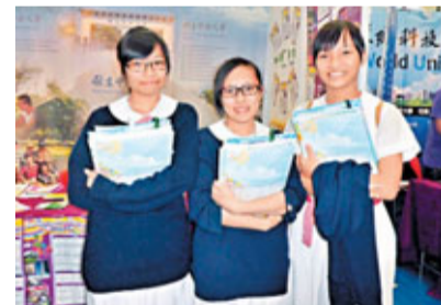
左起：何同學、石同學及李同學表示，難以評估入讀心儀學系各科所需分數。

何同學、石同學及李同學指，第二屆文憑試考生面對不少難題，例如8大取錄文憑試學生均只有一年數據，難以評估入讀心儀學系所需分數，不免影響部署。她們指，一旦未能升讀本地資助學位，都會優先考慮台灣，「本地自資學位一年學費要6萬至8萬港元，但台灣只需1萬多港元，便宜很多」。