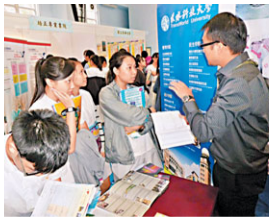
台灣高等教育展2012吸引大批師生到場。

多所簽約的中學昨日安排學生組團到場參觀，保良局胡忠中學中六生林同學及梁同學表示，剛剛出席學校升學講座，獲告知今年升學競爭較去年更激烈，因副學士和重讀生都跟他們爭奪四年制學位。