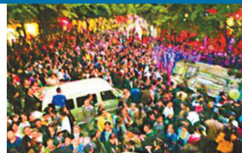
■四川瀘州一違規停車的貨車司機在與輔警的爭執中死亡，引發現場千人聚集。網上圖片

據通報，17日下午5時，瀘州市交警大隊兩名輔警，接令趕赴龍馬潭區紅星路交通擁堵現場疏導，發現一輛白色大貨車違反臨時停車規定。兩名輔警隨即喊話要求該貨車駛離，但該貨車司機拒不配合，辱罵執勤輔警，雙方發生抓扯。其間司機突然感到身體不適，並呼叫「車上有藥」，輔警上車尋藥未果，當地群眾在車內找出藥品給司機服下，此後司機不適症狀加重，輔警隨即呼叫指揮中心通知救護車趕赴現場施救，貨車司機經現場搶救無效死亡。