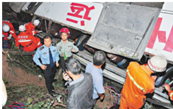
■消防隊員在事故現場施救。