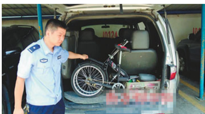
■警員展示涉案單車。