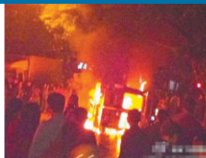
■事件中7輛警車被推翻，5輛被點燃。圖為一警車被燒。網上圖片