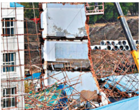
■從塌樓殘垣側面可見，全棟建築物沒有一根鋼筋。

香港文匯報訊 據中央電視台報導：黑龍江集賢縣自來水公司辦公樓15日晨7時50分發生坍塌事故，造成6人死亡，另有2名傷者正在接受醫治，目前救援工作已基本結束。記者18日從集賢自來水公司辦公樓倒塌事故處置工作組獲悉，目前賠償標準仍未確定，事故原因正在調查。記者在現場看到，坍塌的辦公樓由磚和水泥砌成，主承重結構上並沒有鋼筋加固。現場救援人員介紹，整棟樓沒有使用一根鋼筋。