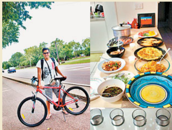
達爾文是個退休之地，但也可以找點新玩意，單車遊是寫意之選。

這幾天在達爾文還有一個非常重要的任務，就是要計劃一下在澳洲的旅遊方式，這關乎我們的澳洲環島之旅是否可以順利進行。最近數月澳元價格高