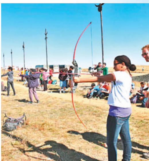
來到這裡，一定要試一下射箭的滋味。

回程路上，驚險萬分。由於來程過於安逸舒服，馬兒在返程時突然狂奔起來，那種速度，那種力度，心都差點跳出來。對於一個從來沒接觸過馬的人來說，這種程度的奔跑已遠遠超越其可接受的範圍，除了盡量控制自己不要尖叫之外，我還嘗試調整身體上下擺動的頻率，想着如何與馬兒融為一體，不一會，已經氣喘吁吁。而且馬兒十分敏感，感覺到附近的馬開始狂奔以後，也跟着跑起來，新手如我實在沒辦法控制牠們的速度，惟有硬着頭皮跟着跑。風馳電掣地策馬奔騰，沒想到竟然在一個意料之外的情況下實現了