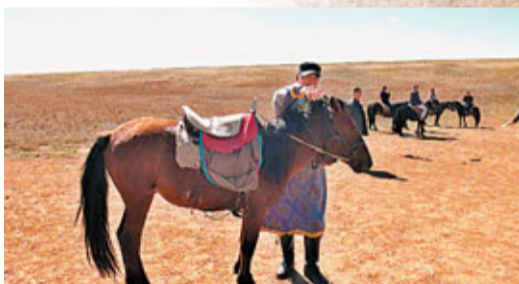
希拉穆仁草原上有大概七八十匹馬兒，牠們受過良好的訓練，脾氣溫和，十分安全。

這個微小的幻想，這次的騎馬經驗可謂十分難得。事後回想起來也覺得很不可思議，或許草原就是這種魅力，讓我們打開心胸，接受一些常規以外的新嘗試。