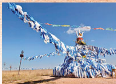
敖包是前往蒙古大草原不可錯過的景點之一。