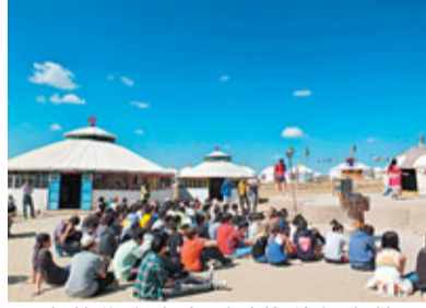
海外學生也來到希拉穆仁大草原考察遊玩。