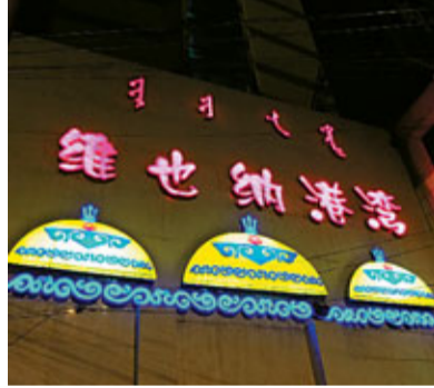
原生態酒吧「維也納港灣」。