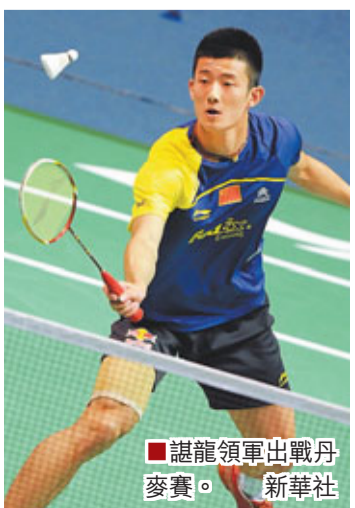
諶龍領軍出戰丹麥賽。

2012年丹麥羽毛球公開賽16日進行了預選賽和混雙第一輪比賽。中國羽毛球隊2對混雙組合徐晨/馬晉、張楠/趙蕓蕾晉級16強。陶嘉明/湯金華慘遭淘汰；男雙新組合柴彭/張楠通過資格預選賽，成功晉級男雙第一輪。