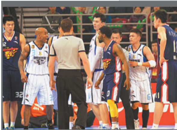
上屆CBA總決賽由北京對廣東於五棵松舉行。

香港文匯報訊 中國籃協官網上宣佈，新賽季CBA聯賽將在今年的11月24日揭幕，這也就意味著北京隊主場迎戰上海的CBA揭幕戰將確定無法在五棵松體育館進行，只能移師首鋼籃球中心。 因中國籃協不願意更改CBA揭幕戰的日期，新賽季的揭幕戰將注定無法在五棵松體育館舉辦，只能改在首鋼籃球中心進行。其實中國籃協也希望把揭幕戰安排在五棵松體育館，他們之前通知場館方面揭幕戰預計是在11月27日左右，當時場館就留出了這幾天的檔期。結果一段時間之後，籃協又通知揭幕戰改在了11月24日，但五棵松體育館在11月25日已經安排了艾頓、莊的演唱會，門票早已開始銷售，無法更改。據場館的工作人員介紹說：「我們盡了最大的努力，希望籃協能把揭幕戰日期更改一下，我們也希望新賽季的第一場比賽能在五