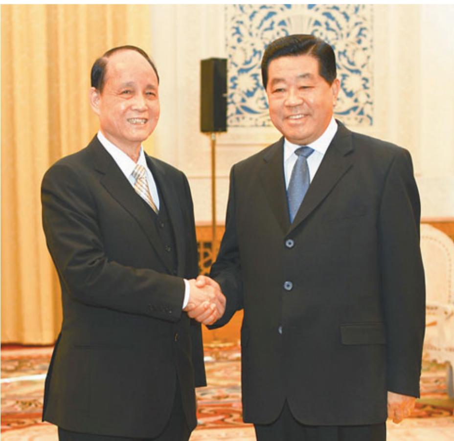
■賈慶林(右)在北京人民大會堂會見海基會新任董事長林中森。