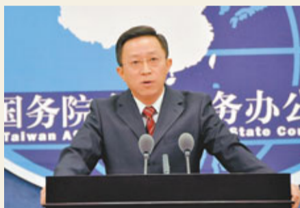
■國台辦新聞發言人楊毅回答記者提問。

香港文匯報訊(記者 高麗丹 北京報導)「十一」黃金周期間，赴台旅遊成為很多大陸遊客的熱門選擇。國台辦新聞發言人楊毅昨日在例行新聞發布會上指出，十一期間共有4.67萬名大陸居民赴台旅遊，其中個人遊的人數同比增長了三倍。而對於近日台灣金融界盛傳大陸封殺台方銀行參股的說法，楊毅表示，支持大陸與台灣兩岸銀行相互參股，不存在封殺台灣銀行參股大陸銀行的問題。