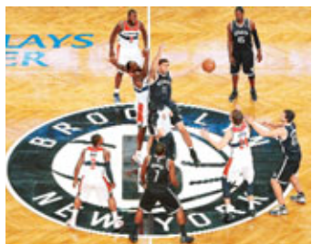
網隊(黑衣)首次在布魯克林新主場比賽。

另外，今季搬往布魯克林的網隊首次在巴克萊中心比賽，最終以98:88旗開得勝，取得新主場「開門紅」。今仗共吸引約1.4萬人入場，主隊網隊沒有令球迷失望，中鋒盧比斯取得18分及11個籃板的「雙雙」成績，加上後備的布洛治貢獻16