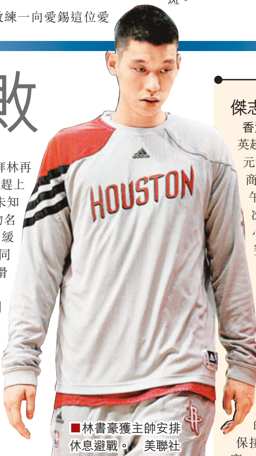
林書豪獲主帥安排休息避戰。