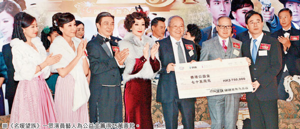
《名媛望族》一眾演員藝人為公益金籌得75萬善款。