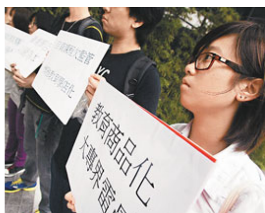
嶺大學生會於立法會申訴部請願。

香港大學校長徐立之和城市大學校長郭位昨均稱,大學轄下社區學院沒有超收學生。郭位表示,超收學生影響教學,校方會小心控制學生人數。