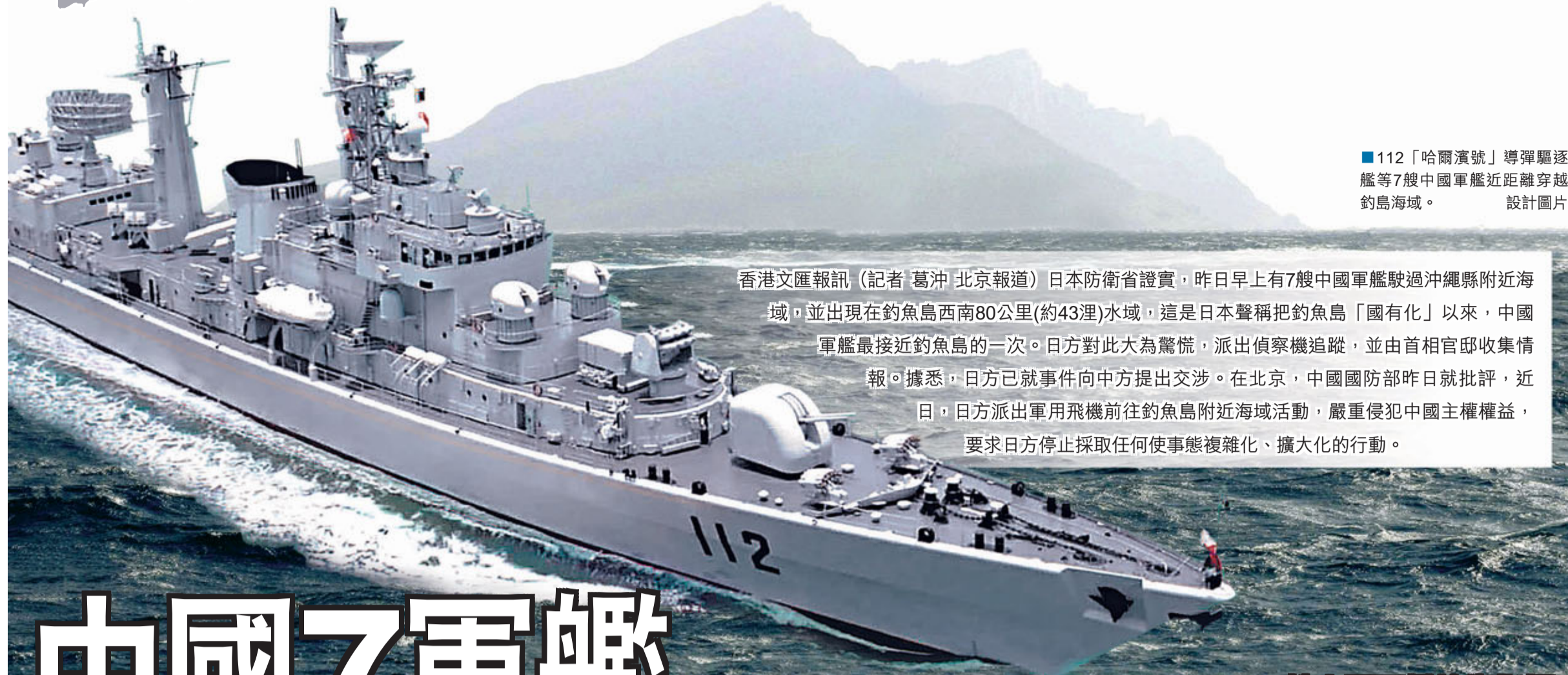
■112「哈爾濱號」導彈驅逐艦等7艘中國軍艦近距離穿越釣島海域。設計圖片

香港文匯報訊(記者 葛沖 北京報導)日本防衛省證實,昨日早上有7艘中國軍艦駛過沖繩縣附近海域,並出現在釣魚島西南80公里(約43浬)水域,這是日本聲稱把釣魚島「國有化」以來,中國軍艦最接近釣魚島的一次。日方對此大為驚慌,派出偵察機追蹤,並由首相官邸收集情報。據悉,日方已就事件向中方提出交涉。在北京,中國國防部昨日就批評,近日,日方派出軍用飛機前往釣魚島附近海域活動,嚴重侵犯中國主權權益,要求日方停止採取任何使事態複雜化、擴大化的行動。