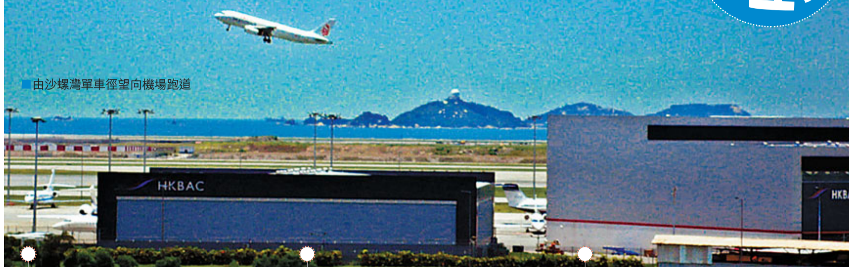
由沙螺灣單車徑望向機場跑道