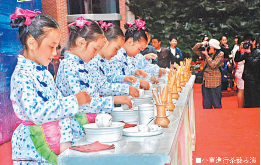
小童進行茶藝表演

在這裡，遊人可以觀賞入選國家級非物質文化遺產名錄的安溪鐵觀音製作技藝，並親自體驗採青、曬青、搖青、攤青、炒青、揉捻、烘培等安溪鐵觀音製作全過程，感受茶鄉特有的風土人情和深厚的茶文