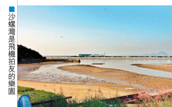
沙螺灣是飛機拍友的樂園