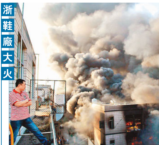
■浙江溫嶺市溫嶺鎮萬嘉鞋業有限公司15日早上5時50分車間突發大火，由於車間裡都是鞋子的原料、膠水和半成品，一時間熊熊烈火將整棟廠房燃燒蔓延，期間發生五次小規模爆炸，截至上午11時火勢被完全撲滅。初步統計過火面積達到1,400平方米。 網上圖片

東北部。項目總建築面積為6.9萬平方米，其中地上建築面積4.7萬平方米，計劃投資6.6億元，設置床位334張。建成投用後，將在充分保障居民基本醫療服務基礎上，靈活發展代辦病、腦血管病等2-3個有潛力的特色專科。