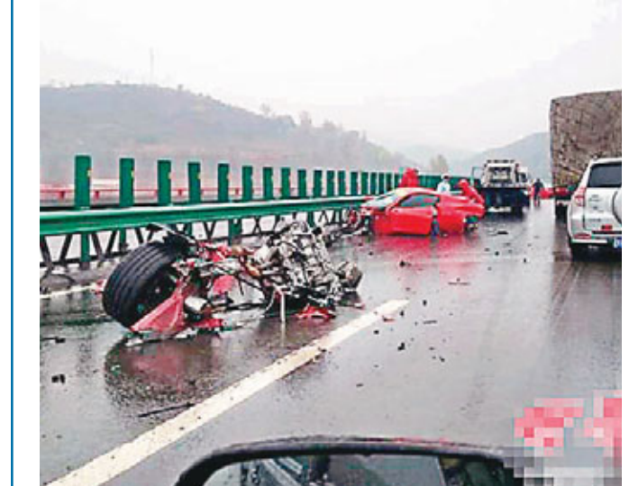
■陝西包茂高速安塞段安塞往北10公里左右15日15:30左右發生一起交通事故。目擊者稱十多輛法拉利車呼嘯而過，其中兩輛發生追尾，一輛嚴重變形，另一輛盡毀。有人夾在車裡，警方已趕到現場警攷。