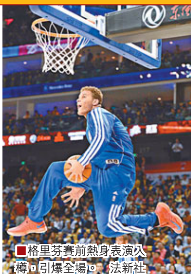
■格里芬賽前熱身表演引燃全場。