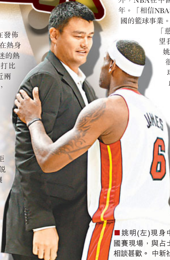
■姚明(左)現身中國賽現場，與占士相談甚歡。

賽後，今夏接受拇指手術直至昨日才正式復出的基斯保羅，在發佈會上感謝中國球迷的支持。他說：「在熱身的時候特別像奧運會的賽場一樣，球迷的熱情感染着我們。我雖然沒有在北京打比賽，不過我在上海趕上了。我有接近兩個月沒有比賽，我一直在練習和恢復，因為我要變得更好。只要停下練習，就會丟失一些東西。所以要迎頭趕上。」 「我覺得我們的隊伍在今年和去年有很多變化。而今天我覺得佐敦表現得太好了，滿場奔跑的他付出了很多的能量。還有格里芬，雖然中距離的投籃不是特別好，但是就像我說的，即便這樣每場比賽我們還是會讓他在同樣的地方投籃，我相信他肯定會變得更好，也一定會成功。」保羅繼續侃侃而談，對隊友大加讚賞。 ■香港文匯報記者 陳曉莉