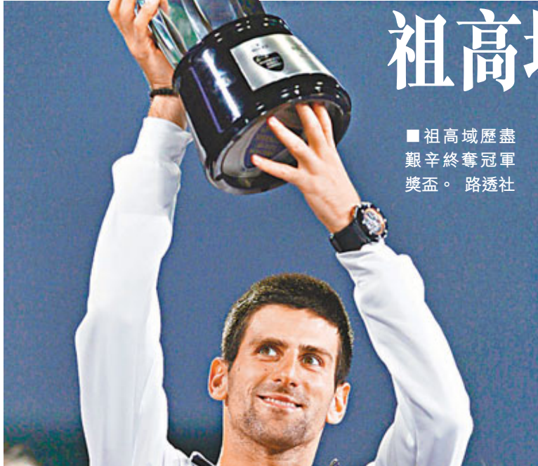
■祖高域歷盡艱辛奪冠軍獎盃。

總獎金額為353.16萬美元的ATP 1000上海大師賽，14日在旗忠網球中心落下帷幕。塞爾維亞「天王」祖高域歷經3小時馬拉松大戰，次盤挽救5個賽點後以5：7、7：6(13)、6：3反勝英國天才梅利，粉碎了後者三連冠美夢。這場比賽同時也是祖高域兩週內在中國取得的連續第10場勝利，也是他職業生涯第13個大師賽冠軍。賽後，在主持人的引導下，心情極佳的祖高域還秀了一句漢語：「上海是我家，贏得掌聲不斷。」 是場比賽的轉折點發生在第二盤第10局。當時梅利失誤，痛失賽局賽點；但祖高域則不斷向對手施壓，並成功反破，迫使比賽進入決勝局(搶七)。惟梅利在決勝局6：4、8：7、9：8連連葬送4個賽點。最後，已經挽救5個賽點的