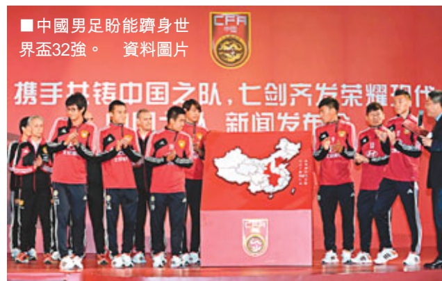
■中國男足盼能躋身世界盃32強。資料圖片

中國足協為11月足代會而制定的《中國足球十年發展規劃》明確提出「男足要進軍2018年和2022年世界盃，女足要重返亞洲前三」等具體目標。 據內地報章《京華時報》消息，《中國足球十年發展規劃》將提交到足代會審核。據悉，足協內部在討論後採納了多方意見，並多次加以討論修改。其