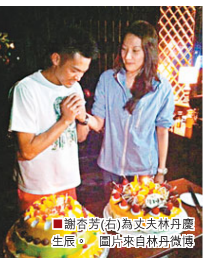
■謝杏芳(右)為丈夫林丹慶生。

據中新社廣州14日電 羽毛球世界冠軍林丹14日攜首次出版的自傳《直到世界盡頭》在廣州購書中心舉行簽售會。不久前完婚的林丹在接受媒體採訪時表示，未來生活重心將逐漸偏向家庭，在賽場上最希望看到家人現場看比賽，「那樣壓力也不會那麼大」。