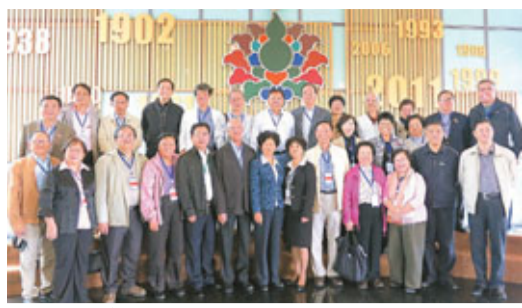
考察團參觀雲南白藥新基地。黃斯昕 攝