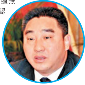
潼南縣委書記、縣長辛國榮

其中, 無公害蔬菜產業是潼南效益最高、農民增收最多的特色農業產業。作為全國無公害蔬菜生產優秀示範縣, 潼南已通過無公害蔬菜基地縣整體認證, 成功認證103個無公害產品, 69個優質農產品, 並註冊「潼南綠」蔬菜集體商標。此外, 潼南還建立起完備的產品追溯機制, 嚴格把持播種、施肥、市場等各环节的食品安全, 為重慶乃至全國提供綠色健康蔬菜。