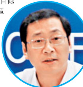
渝中區委書記劉強

素有「內陸香港」之稱的重慶渝中區位居渝中半島, 島上高樓林立, 商貿繁榮, 稅收上億元樓宇達16幢; 該區沒有農業, 服務業佔生產總值95%, 其中現代服務業比重達60.5%; 百餘家世界500強企業在渝中區設立重慶區總部, 是重慶經濟最發達的區縣之一。2011年渝中區GDP總值665.3億元人民幣, 人均GDP逾10萬人民幣, 居重慶之首。