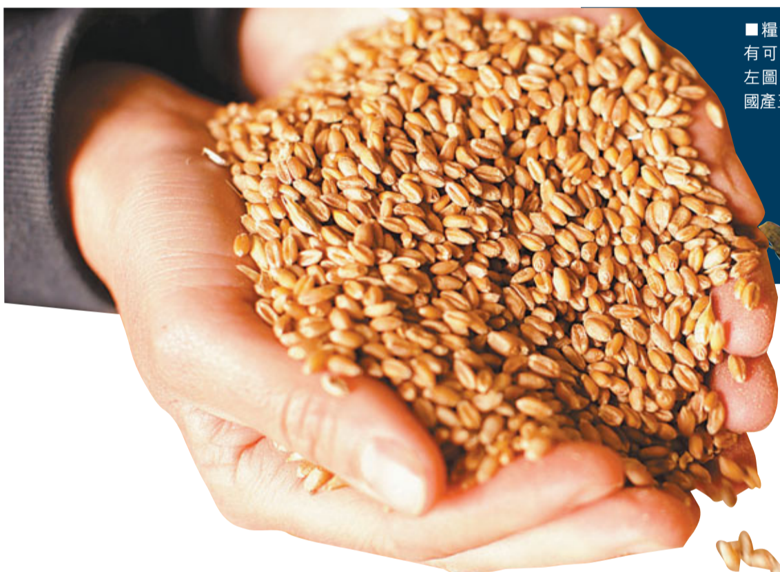
糧食產量下跌，明年有可能出現糧食危機。左圖為穀物，右圖為美國產玉米。