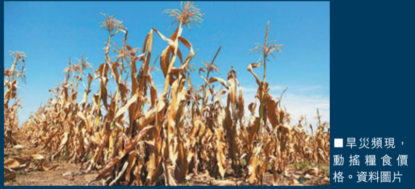
旱災頻現，動搖糧食價格。