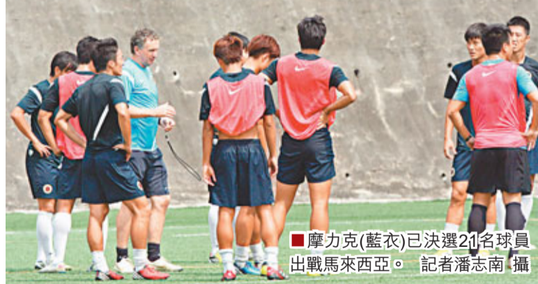
摩力克(藍衣)已決選21名球員出戰馬來西亞。