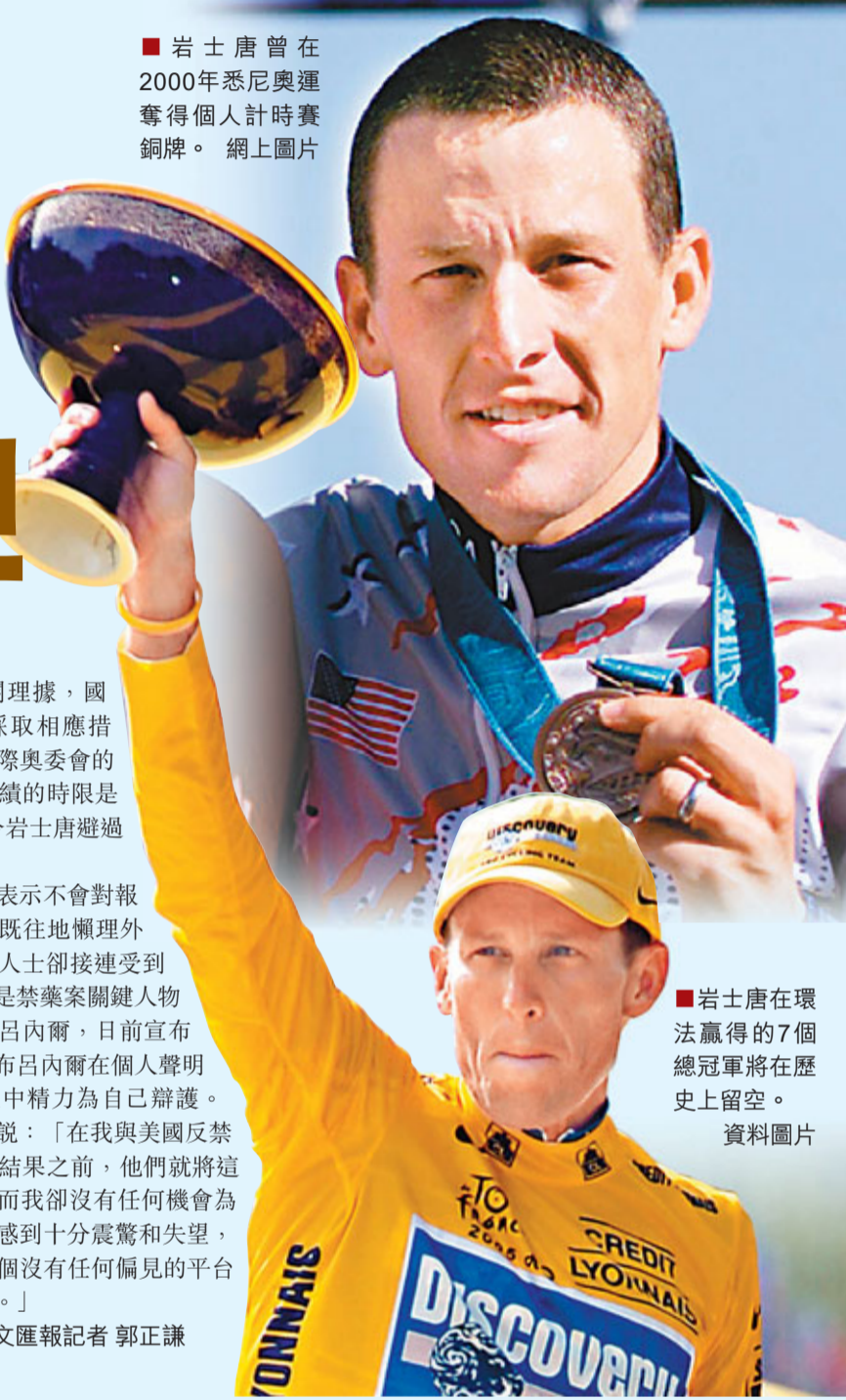
岩士唐在環法贏得的7個總冠軍將在歷史上留空。資料圖片