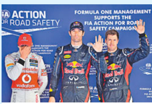
韋伯(中)向現場車迷揮手致意。