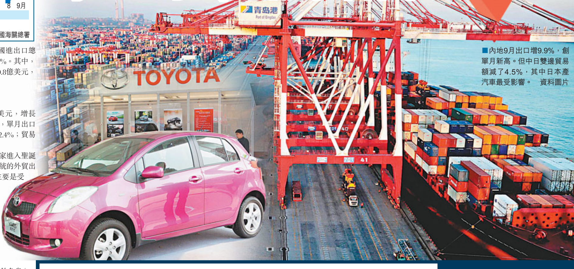
■內地9月出口增9.9%，創單月新高。但中日雙邊貿易額減了4.5%，其中日本產汽車最受影響。 資料圖片