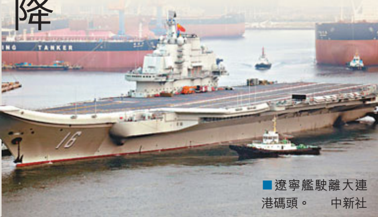
■遼寧艦駛離大連港碼頭。

隨後，網友曝光了一組遼寧艦照片，從中可以發現殲15艦載戰鬥機已在遼寧艦上實現觸艦復飛，殲15處於遼寧艦的降落跑道上方。此外，直8艦載直升機降落在航母甲板上，引導直升機着艦的艦員穿上了帶顏色標記的「馬甲」，其中，藍色馬甲背後標有「四站」字樣，業內人士介紹，「四站」指的是航空勤務中最重要的製氧站、充氧站、冷氣站和充電站。