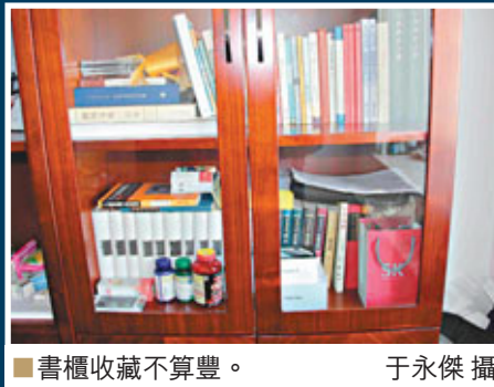
■書櫃收藏不算豐。