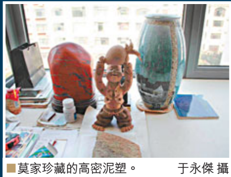
■莫家珍藏的高密泥塑。