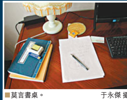
■莫言書桌。