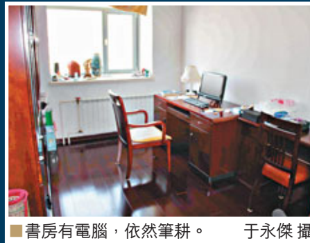
■書房有電腦，依然筆耕。