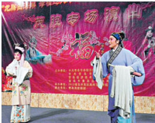
■莫言促成家鄉戲——高密茂腔晉京演出。

上，頭頭鏘到莊稼上，花針扎到指頭上。」表明當地人對茂腔的入魔程度。2009年7月，被首批列入國家級非物質性文化遺產名錄的高密茂腔和莫言一起登上央視舞臺。 ■香港文匯報記者 殷江宏