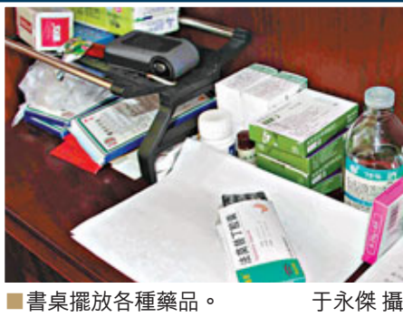
■書桌擺放各種藥品。