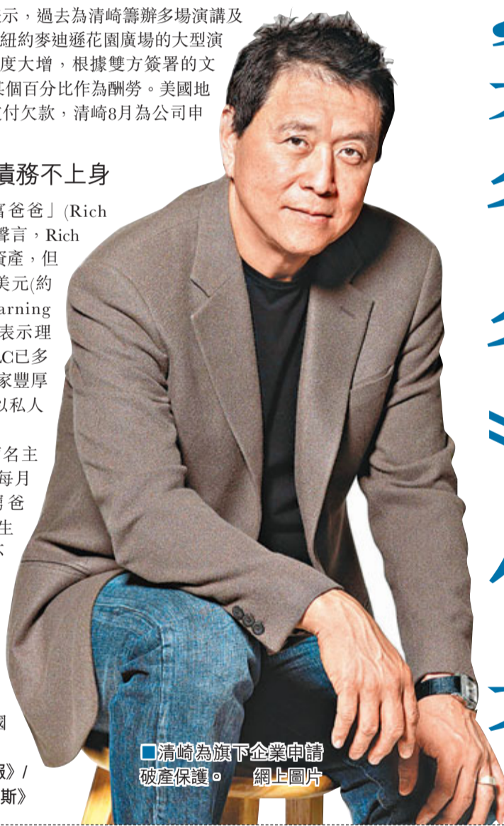
清崎為旗下企業申請破產保護。