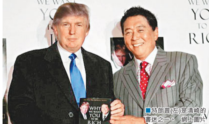
特朗普(左)是清崎的書迷之一。