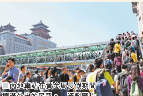
內地車站在黃金周假期期間擠滿外出的民眾。

維修缺錢 要靠稅款補貼 有經濟學者認為，高速公路的維修、建造均需要大量金錢，若免收通行費，那麼由誰來支付有關費用？若由政府支付，便等於由納稅人補貼公路使用者。