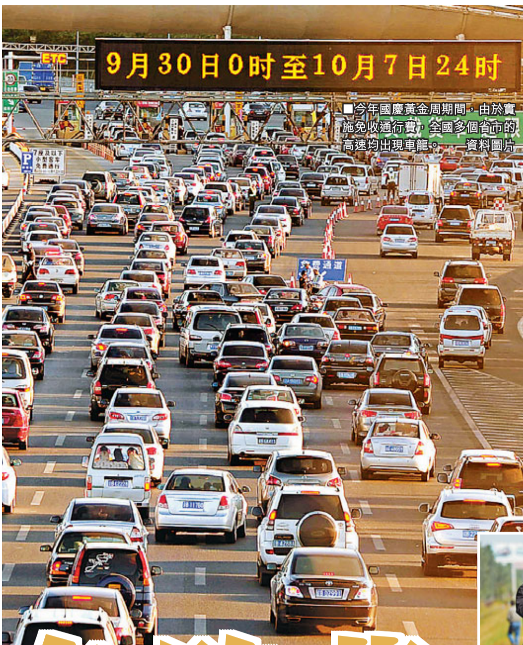
今年國慶黃金周期間，由於實施免收通行費，全國多個省市的高速均出現車龍。