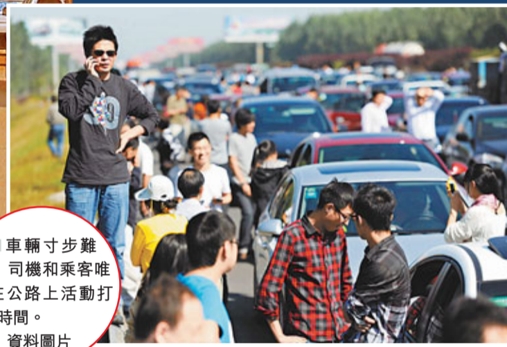
車輛寸步難行，司機和乘客唯有在公路上活動打發時間。