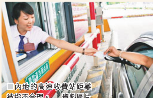
內地的高速收費站距離被指不合理。

反對 吸小型客車「打蛇餅」 不過，也有人反對免收通行費，因為這會吸引更多車輛在節日假期行走，導致堵車。舉例而言，夫婦兩人駕車從北京到廣州遊玩，單程所需繳付的高速公路費用需要過千元人民幣，而列車硬臥一張票只需450元人民幣，兩者相比，駕車未必是一個好選擇；不過，免收通行費會吸引這批擁有車輛但不願繳付大量高速公