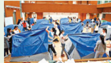
學生努力架起帳幕。

學生須在禮堂紮營留宿，要親自建造「家園」。紮營其實是「大學問」，同學分組協作搭起帳幕，但首次紮營不免手忙腳亂，花了不少時間，終於完成。最後24個帳幕在禮堂內整齊架起，學生滿足感難以言喻。學生還參與各式各樣訓練，加深了