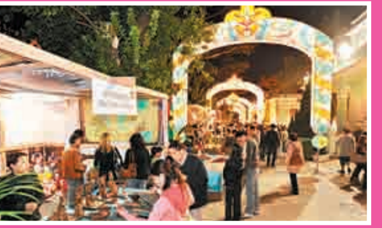
■在「葡韻嘉年華」舉行期間，氹仔龍環葡韻及舊區多條街道將以葡國傳統特色粉飾佈置，充滿異國風情。