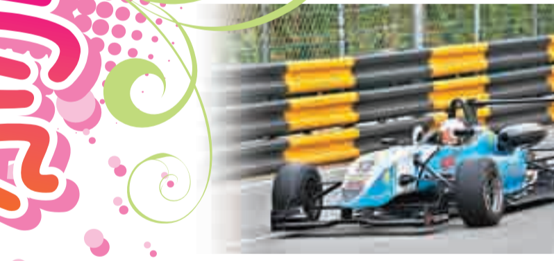
萬眾期待的年度盛事「第59屆澳門格蘭披治大賽車」，將於11月15至18日舉行，今年的賽程，除「澳門格蘭披治三級方程式大賽」、「FIA世界房車錦標賽—澳門東望洋大賽」、「格蘭披治電單車大賽」3項頂級賽事外，同時也設有「澳門GT盃」、「澳門房車盃」、「澳門路車挑戰賽」及「澳門/香港埠隊賽」4項支援賽事。

精彩預告 萬眾期待車壇盛事「第59屆澳門格蘭披治大賽車」 萬眾期待的年度盛事「第59屆澳門格蘭披治大賽車」，將於11月15至18日舉行，今年的賽程，除「澳門格蘭披治三級方程式大賽」、「FIA世界房車錦標賽—澳門東望洋大賽」、「格蘭披治電單車大賽」3項頂級賽事外，同時也設有「澳門GT盃」、「澳門房車盃」、「澳門路車挑戰賽」及「澳門/香港埠隊賽」4項支援賽事。 其中最矚目的3項頂級賽事是每年大賽車的必看賽事，當中榮膺國際汽聯三級方程式洲際盃的「三級方程式大賽」今年踏入30周年，過去一直吸引不少年輕車手爭相參與，在這種極高的期望下望遠望大顯身手，從而獲得一級方程式車隊的青睞，本屆的24位一級方程式車手中有17位便曾參加過澳門格蘭披治大賽車。而於3月11日在意大利蒙沙展開的「FIA世界房車錦標賽」，歷兩回合賽事再次在東望洋賽道上演，賽事總冠軍亦將連續第8年在澳門誕生，今年房車車手陣容鼎盛，前一級方程式車手及年輕新秀齊首一堂，在賽道上「一決雌雄」。此外，賽事歷史悠久的「澳門格蘭披治電單車大賽」，則被認為是世界上最具挑戰性的電單車街道賽，每年都吸引一眾來自歐洲、北美及亞洲的公路賽車手踴躍參與，今年將再度掀起連場刺激爭鬥。 日期：11月15至18日