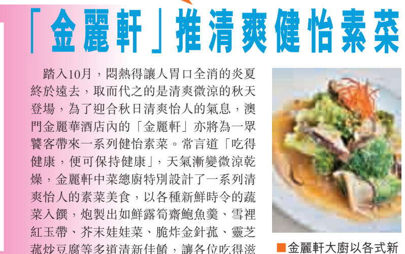
■金麗軒大廚以各式新鮮時蔬入饌，炮製出多道清爽健康佳餚。

識飲適食 一年一度「澳門美食節」，每年吸引數千上萬的市民及遊客，爭相入場品嚐美食。 踏入10月，悶熱得讓人胃口全消的炎夏終於過去，取而代之的是清爽怡人的秋天登場，為了迎合秋日清爽怡人的氣息，澳門金麗軒酒店內的「金麗軒」亦將為一眾食客帶來一系列健康養生、常言道「吃得健康，便可保持健康」，天氣漸變涼爽乾燥，金麗軒中菜廚特別設計了一系列清爽怡人的素食美食，以各種新鮮時令的蔬菜入饌，炮製出如鮮露香滑鮑魚羹、雪裡紅玉帶、芥末娃娃菜、脆炸金針菇、蜜芝紅豆腐等多道清新佳餚，讓各位吃得滋味又健康。