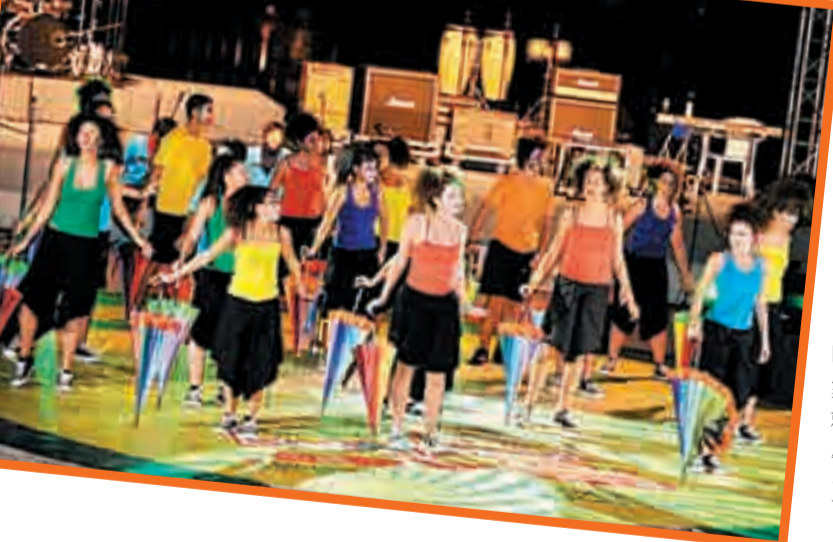
■於「文化周」舉行期間，每晚都有多隊葡語國家及中國的表演團隊為觀眾帶來連場特色歌舞表演。

此外，將於10月12日至18日舉行的「第四屆中國—葡語國家文化周」，作為展示中國與葡語國家特色文化及藝術的平台，「文化周」活動，將在澳門議事亭前地、友誼廣場、大三巴等多個地點進行，在為期一週內為各位呈獻多個充滿中西文化氣息的節目。 今年的精彩內容包括「中國及葡語國家手工藝市集」，邀請10個葡語國家和地區的手工藝大師，與中國新疆的手工藝家一同來澳交流，以木、布、貝殼、鐵為主的各項手工藝精品，讓觀眾一睹中國與葡語國家手工藝的新奇創意。在「文化周」舉行期間更會舉辦「葡語國家美食推介」，特別邀請了來自佛得角、幾內亞比紹、果阿、達曼和第烏、莫桑比克及葡萄牙的5位廚師，烹調出多款美食佳餚供參加者品嚐。此外，還請來多隊葡語國家及中國新疆的表演團隊，在議事亭前地進行連番精彩的歌舞演出，為現場觀眾放歌歡舞。豐富節目當然少不了歡欣熱鬧的大巡遊表演，於10月13日下午4時，由澳門、中國新疆及葡語國家組成的巡遊隊伍將由大三巴起步巡遊至議事亭前地，沿途邀請途人參與其中，齊齊載歌載舞，熱鬧一番。 【2012葡韻嘉年華與中國—葡語國家文化周】 日期：10月12至21日 地點：氹仔龍環葡韻、嘉模墟、澳門議事亭前地、友誼廣場、大三巴等