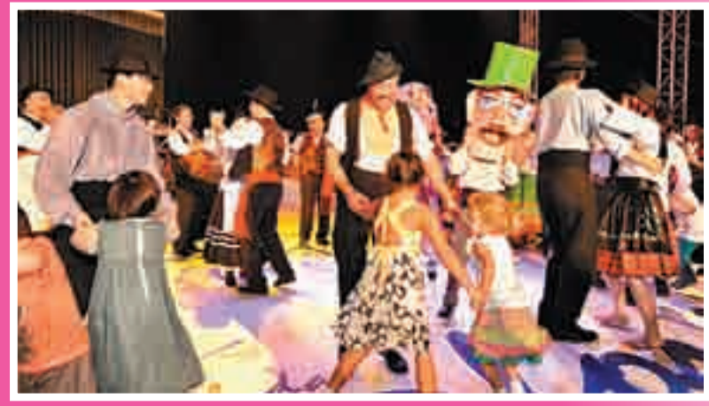
■嘉年華氣氛熱鬧，充斥著葡聲樂韻，讓遊人感受別具特色的葡俗風情。