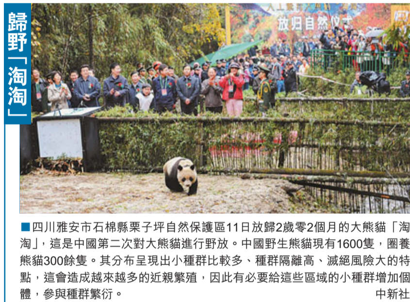
■四川雅安石棉縣栗子坪自然保護區11日放歸2歲零2個月的大熊貓「淘淘」，這是中國第二次對大熊貓進行野放。中國野生熊貓現有1600隻，圈養熊貓300餘隻。其分布呈現出小種群比較多、種群隔離高、滅絕風險大的特點，這會造成越來越多的近親繁殖，因此有必要給這些區域的小種群增加個體，參與種群繁衍。中新社