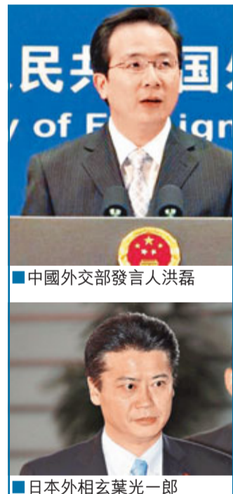
中國外交部發言人洪磊 日本外相玄葉光一郎

香港文匯報訊(記者 葛沖 北京報導)外交部發言人洪磊昨日在例行記者會上駁斥了日本外相玄葉光一郎有關中方對釣魚島主權主張不成立的說法,稱其用斷章取義的材料試圖支撐日方在釣魚島問題上的立場「完全是強盜邏輯」。