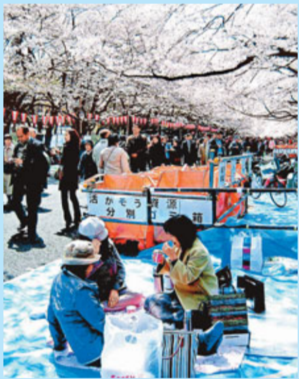
中國遊客紛紛取消赴日行程,昔日北海道人流如鯽的景況不再。

香港文匯報訊(記者 涂若奔)中日關係因釣魚島爭端陷入僵局,多家內地航空公司近期均削減了來往日本的航班。東方航空昨日透露,由於國際客運需求下跌,公司9月份國際航線客運量為64.13萬人次,同比僅增長3.6%,較8月份環比大跌18%,創下今年2月以來最大跌幅。