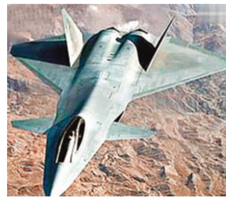
中國第五代戰鬥機殲-25「鬼鳥」。網上圖片

《簡氏》通過對目前所掌握的資料分析之後認為,中國第五代戰鬥機從總體要求上看,將是一種全新的高性能、多用途、全天候的空中優勢戰鬥機。這種戰鬥機將以重型、低成本為主導思想,以高性能、高生存力、高作戰效能為設計目標,要求飛機有大推重比,非加力超音速巡航;具有中國特色的隱形性能;具有很高的敏捷性和失速機動性。