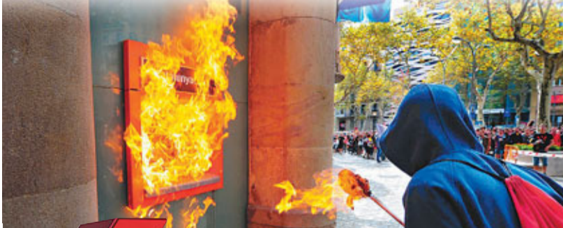
■大學生抗議政府削減教育開支，焚燒銀行提款機洩憤。