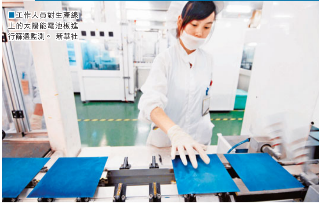
■工作人員對生產線上的太陽能電池板進行篩選監測。

美方裁決針對的中國太陽能廠商，包括英利綠色能源、尚德電力、天合光能等。而今年以來，中國光伏產業遭遇多面夾擊，除美國外，歐盟委員會9月6日對中國光伏電池發起反傾銷調查，這是迄今對中國最大規模的貿易訴訟，涉案金額超過200億美元（約1300億元人民幣）；印度反傾銷局近日也發佈公告稱，該局9月12日收到企業申請，要求對原產於中國等地的太陽能電池組件或部分組件進行反傾銷調查。