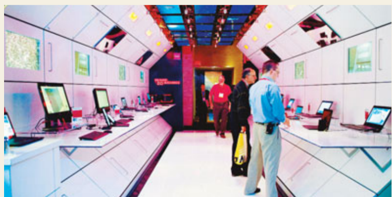
■在美國拉斯維加斯國際消費電子展上，觀眾在聯想展區參觀。

香港文匯報訊（記者 陳遠威）據彭博引述Gartner第三季調查數據指，聯想(0992)在全球個人電腦(PC)市場的市佔率達15.7%，超越惠普的15.5%，打破惠普6年來的龍頭地位，成為全球最大個人電腦生產商。聯想昨收報6.19元，升0.324%。