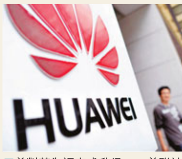
■美對華為調查或升級。

美國眾議院的調查報告也遭到美國媒體的質疑。美國有線電視新聞網CNN報道認為「調查報告中並沒有關於這兩家企業不當行為的證據。」美國波士頓《環球郵報》刊文指出，「大部分的擔憂都是缺乏事實根據的」，從根本上說，美方的質疑反映了中美之間的互不信任程度。