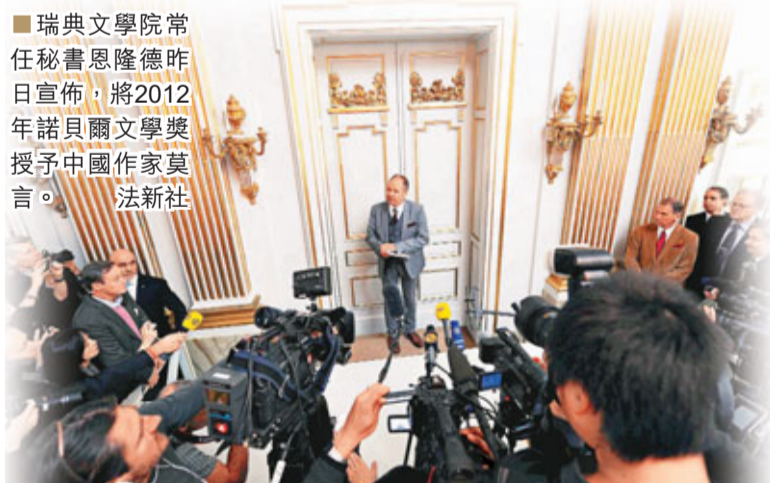
瑞典文學院常任秘書恩隆德昨日宣佈，將2012年諾貝爾文學獎授予中國作家莫言。

莫言是中國當代著名作家，原名管諶業，生於山東高密市。自1980年代中以一系列鄉土作品崛起，充滿着「懷鄉」以及「怨鄉」的複雜情感，被歸類為「尋根文學」作家，代表作有《紅高粱》、《檀香刑》、《豐乳肥臀》、《酒國》、《生死疲勞》、《蛙》。