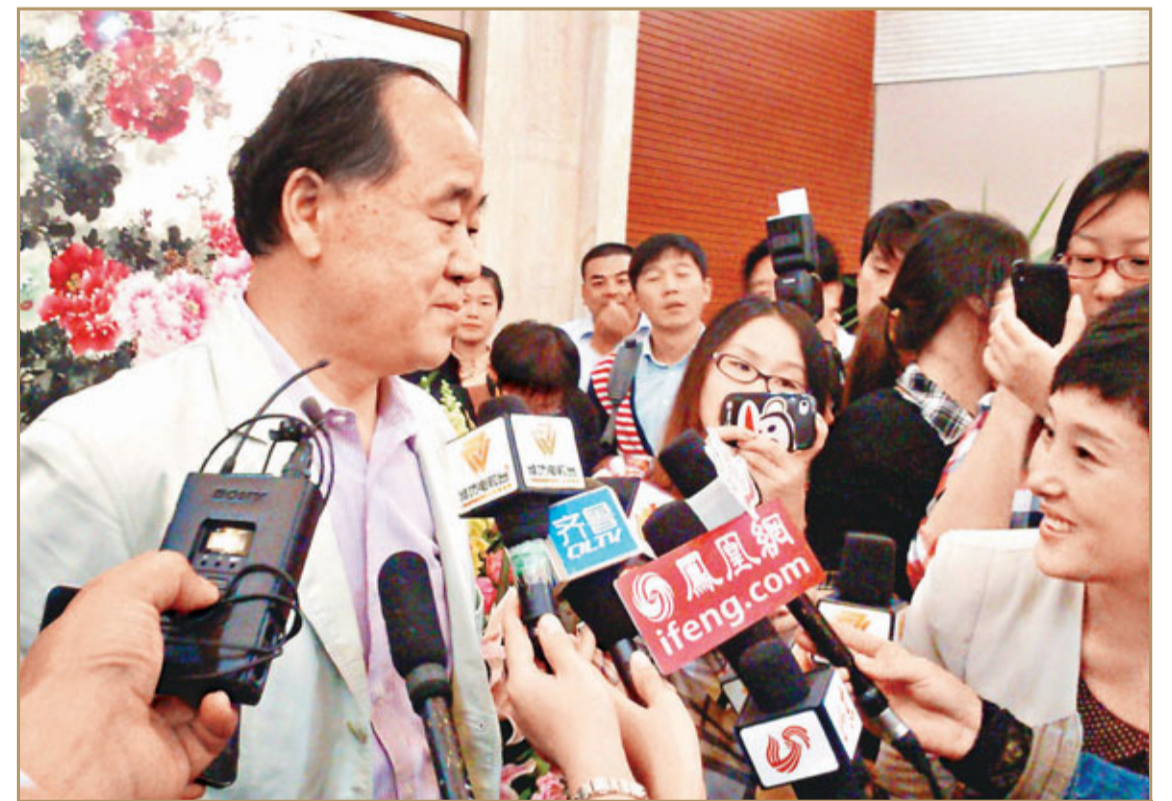
莫言昨日獲諾貝爾文學獎後，在老家山東高密接受記者採訪。

現名：莫言 原名：管諶業 國籍：中國 出生地：山東省高密市大柵鄉 出生日期：1955年2月17日 職業：作家 畢業院校：解放軍藝術學院文學系；北京師範大學魯迅文學院創作研究生班；香港公開大學榮譽文學博士 主要成就：十月優秀作品獎、20世紀中文小說100強、大家文學獎、鼎鈞雙年文學獎、福爾亞洲文化大獎 主要代表作：《紅高粱家族》、《檀香刑》、《豐乳肥臀》、《酒國》、《蛙》、《生死疲勞》