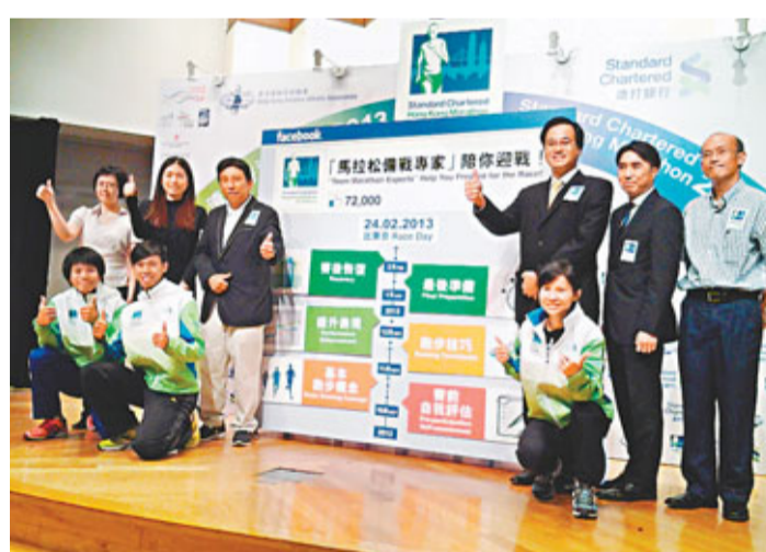
■馬拉松備戰專家組向參賽者提供意見。