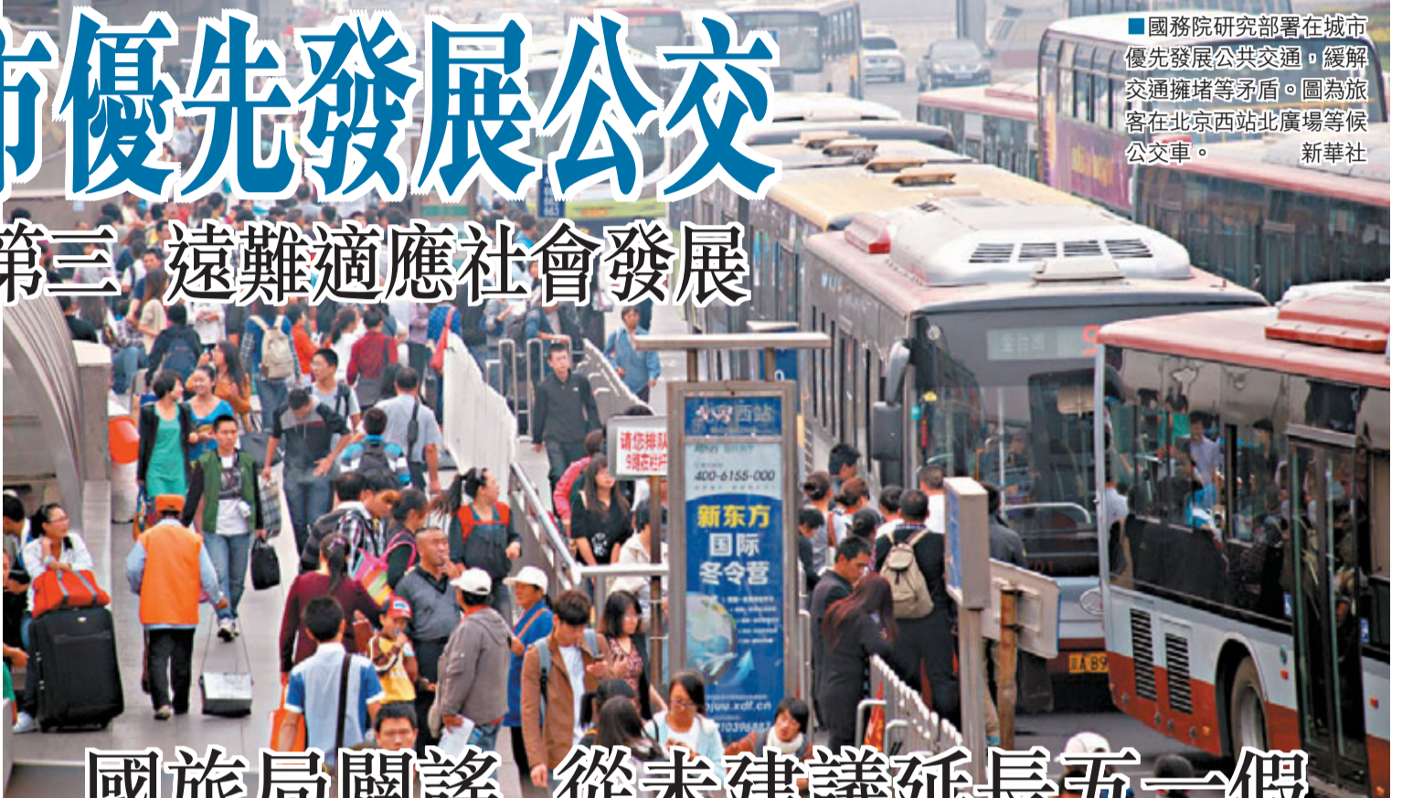
■國務院研究部署在城市優先發展公共交通,緩解交通擁堵等矛盾。圖為旅客在北京西北站北廣場等候公交通車。

此外,會議還決定擴大中等職業教育免學費範圍,完善國家助學金制度。為加快發展中等職業教育,促進教育公平,提高勞動者素質,會議決定,自2012年秋季學期起,將中等職業教育免學費範圍由涉農專業學生和家庭經濟困難學生,擴大到所有農村(含縣鎮)學生、城市涉農專業學生和家庭經濟困難學生。同時,將中等職業學校國家助學金資助範圍由一、二年級農村(含縣鎮)學生和城市家庭經濟困難學生,分步調整為一、二年級涉農專業學生和非涉農專業家庭經濟困難學生。將六盤山區等11個連片特困地區、西藏及四省藏區、新疆南疆三地州中等職業學校農村學生全部納入享受助學金範圍。