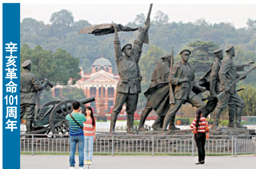
辛亥革命101周年 ■昨日是辛亥革命101周年紀念日。1911年10月10日,武昌起義打響了推翻清朝政府的第一槍,結束了中國兩千多年的封建統治。圖為遊客在武昌首義廣場為紀念辛亥革命100周年而建的《走向共和》雕塑前留影。

著名旅遊專家、中國社會科學院旅遊研究中心特約研究員劉思敏博士向本報表示,以現階段中國社會的發展,侵害勞動者權益的情況比比皆是,很多企業仍實行周六工作制,落實帶薪休假制度將是一個循序漸進的緩慢過程。