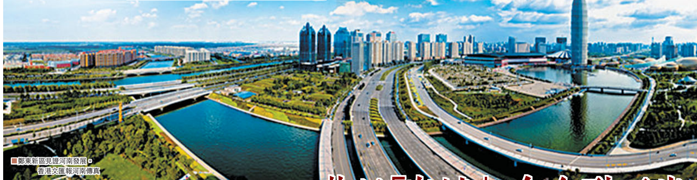
鄭東新區見證河南發展。