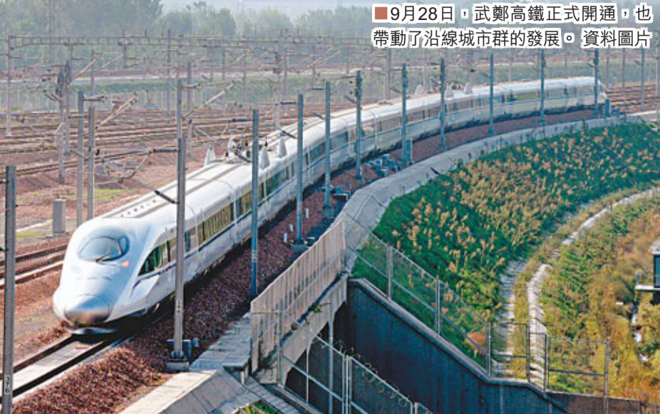
9月28日，武鄭高鐵正式開通，也帶動了沿線城市群的發展。資料圖片