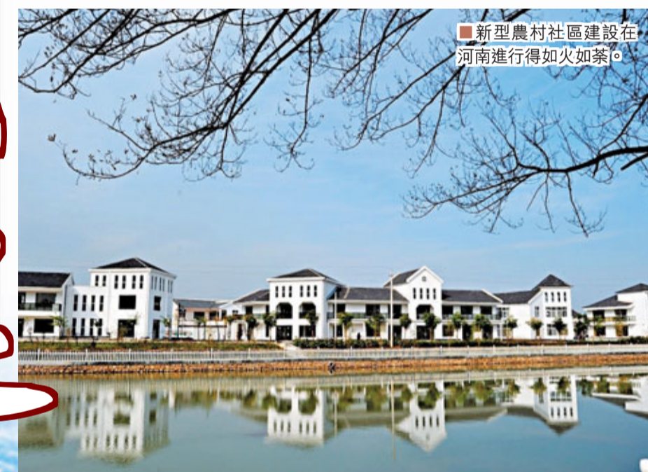
新型農村社區建設在河南進行得如火如荼。

有專家指出，可以預見20年後，通過新型農村社區建設，河南18萬個自然村將面貌一新，並能節約出600萬畝土地，用於復耕和建設。