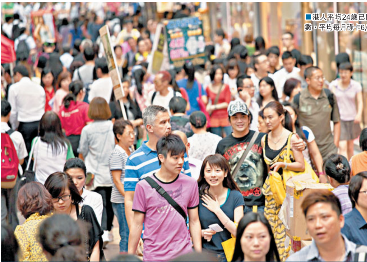
港人平均24歲已開始預卡數,平均每月碌卡6,685元。

在該調查中,欠卡數的人士中,有71%的人仍繼續高消費活動,有39%的人會到人均消費達500元以上的餐廳用膳,36%仍購買新智能手機等,而受訪者中的269名八十後就更顯瘋狂,有41%仍購買新智能手機,37%堅持在仍欠卡數的情況下旅行。 在欠下大額卡數的情況下,八十後表示卡數影響人生大計,當中分別有46%及38%指欠卡數影響買樓及結婚大計,因為他們在欠卡數時,還款佔收入比例亦分別只佔收入的34%及29%,足見若在無欠卡數情況下,八十後其實可更好利用該筆款項,更有機會完成置業夢。