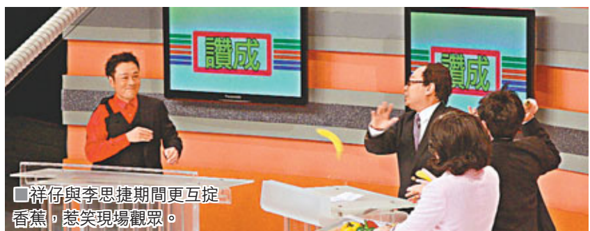
祥仔與李思捷期間更互控香蕉，惹笑現場觀眾。