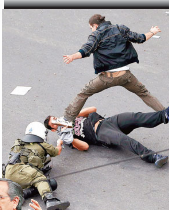
■警方追捕示威者時雙雙倒地，但仍繼續扯衫。