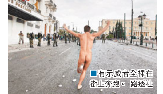
■有示威者全裸在街上奔跑。

默克爾在希臘只逗留6小時，會與總理薩瑪拉斯、總統帕普利亞斯及當地商界代表會面。希臘政府發言人稱，此行反映德國對希臘政府及經濟的信心，最大反對派激進左翼聯盟領袖