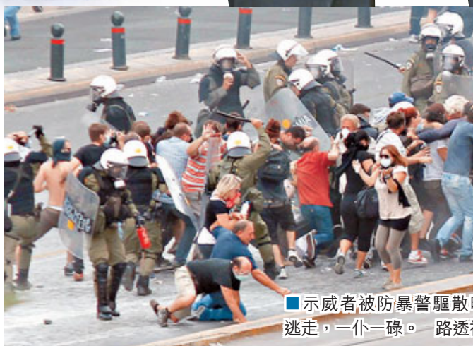
■示威者被防暴警驅散時逃走，一仆一碌。