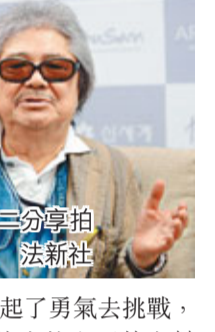
若松孝二分享拍戲心得。