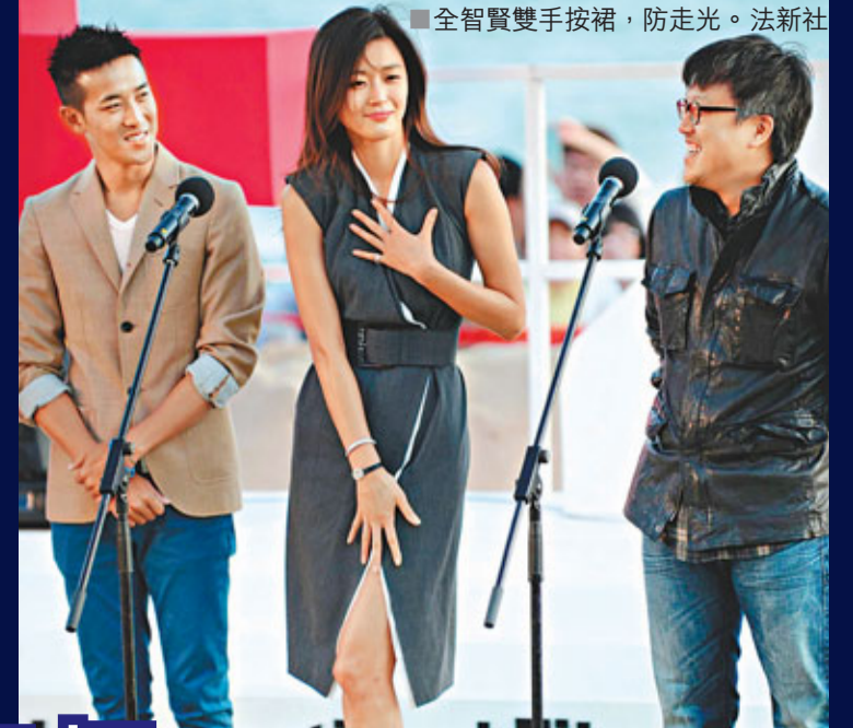
全智賢雙手按裙，防走光。