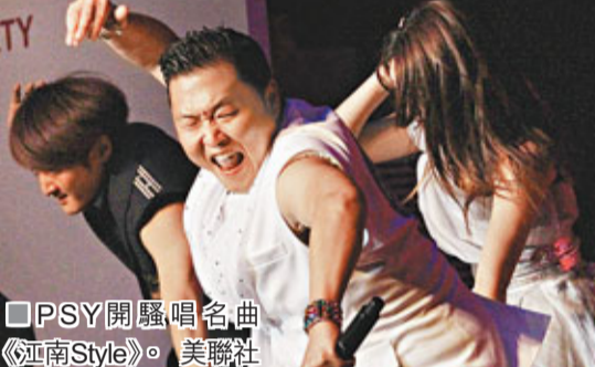
PSY開騷唱名曲《江南Style》。

傳新作《光海，成為王的男人》，期間他開玩笑說柳承龍像孩子般可愛，更伸手摸對方的頭，惹笑全場。而近期紅爆的韓國R&B男歌手PSY前晚亦出席影展的樂天之夜，大唱熱爆作品《江南Style》，不過，近日卻傳出該曲中的騎馬舞其實是其歌手好友金長助的創意，金長助不堪PSY偷橋，仰藥自殺獲救。 ■文：Mana