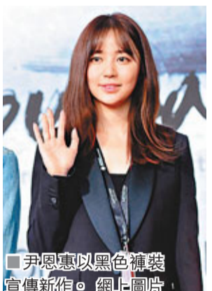
尹恩惠以黑色褲裝宣傳新作。網上圖片