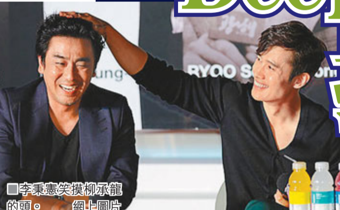
李秉憲笑摸柳承龍的頭。

上映近兩個半月的《盜賊門》於本月2日憑着超過1302萬入場人次力壓《韓流怪嚇》，成為最多人觀看的韓片冠軍，因此昨日的放映會亦吸引不少影迷到場支持，現場人山人海，全智賢在工作人員護送下抵達現場，並不時向在場影迷揮手；任達華則風騷地拖着戲中情人金海淑踏紅地毯，可惜人氣男星金秀賢缺席盛事，略為美中不足。