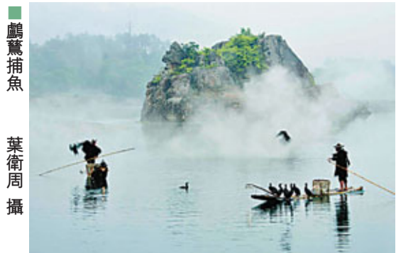
■ 鱸魚捕魚