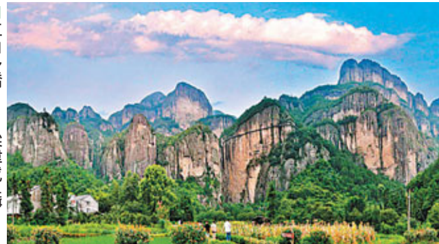
■ 江山多嬌