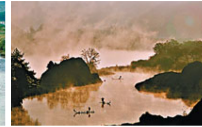
■ 楠溪漁曲