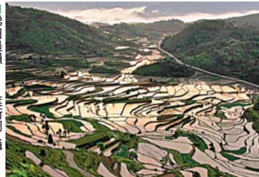
■ 梯田農韻