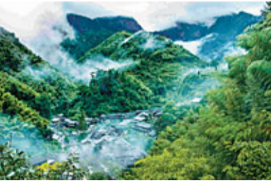
■ 林坑古村

楠溪江之美，美在原始古樸、野趣天然。楠溪江溪流清澈峻茂，秀麗多姿，隨江倒影，水清見底，游魚碎石，歷歷在目。經專家鑒定，楠溪江水含沙量僅為每立方米萬分之一克，水質呈中性，PH值為7，符合國家