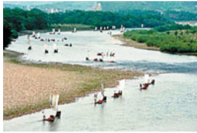
■ 楠溪漂流