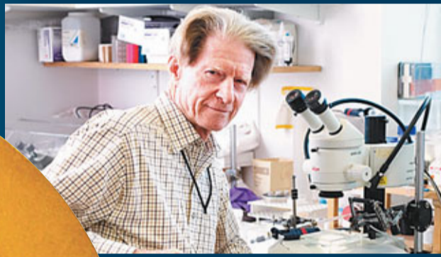
格登(左圖)及山中伸彌(中圖)有機會問鼎醫學諾獎。