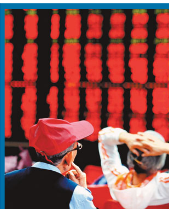
■A股今日復市，迎來第四季首個交易日，市場期望「開門紅」。

此外，上週雙節期間外圍市場持續造好，尤其是美國上週五公佈的失業率降至7.8%，創奧巴馬執政以來的新低，刺激了歐美股市，美、法、德、英股分別上漲0.26%、1.6%、1.3%、0.7%。港股更連升5日，重上21,000點。全周計，上週道指和港股分別上漲了0.67%和0.83%。這些利好因素均為A今日開門紅奠定