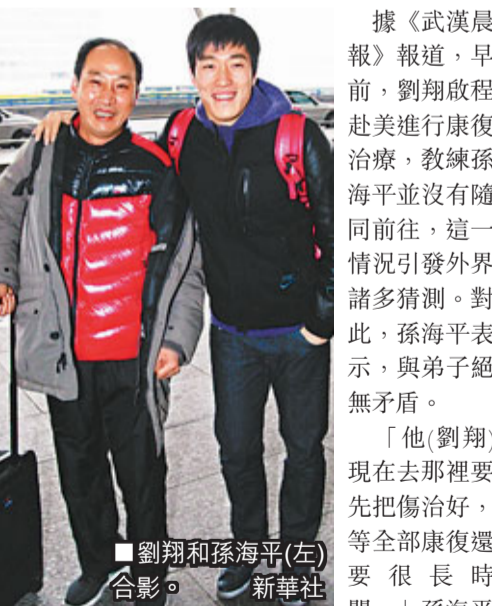
劉翔和孫海平(左)合影。

據《武漢晨報》報道，早前，劉翔啟程赴美進行康復治療，教練孫海平並沒有隨同前往，這一情況引發外界諸多猜測。對此，孫海平表示，與弟子絕無矛盾。「他(劉翔)現在去那裡要先把傷治好，等全部康復還要很長時間。」孫海平說，自己早去美國沒有用武之地。劉翔的父親劉學根也解釋說：「孫指導身上還有任務，明年有全運會，下面還有一批小孩要帶，所以暫時不去美國，這也是上海體育局方面的決定。」不過，孫海平依然牽掛着大洋彼岸的弟子，「我也要等那邊的消息，隨時準備着，一旦劉翔康復了，可以開始訓練了，我就會過去。」至於劉翔與孫海平之間關係變化的傳聞，孫海平輕笑着說：「傳聞中我和劉翔的矛盾並不存在，劉翔也從來沒有埋怨過我，只要他能恢復，能重新比賽，那我們肯定還是綁在一塊的。」至於劉翔明年能不能參加全運會，孫海平說：「現在一切還都是未知數，但我可以確定的是，劉翔的個人能力還在那兒，只要康復得當，還是很有實力的。」 ■香港文匯報記者 梁啟剛