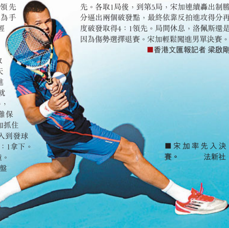
宋加率先入決賽。