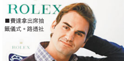
費達拿出席抽籤儀式。