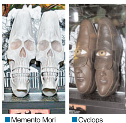
Memento Mori Cyclops