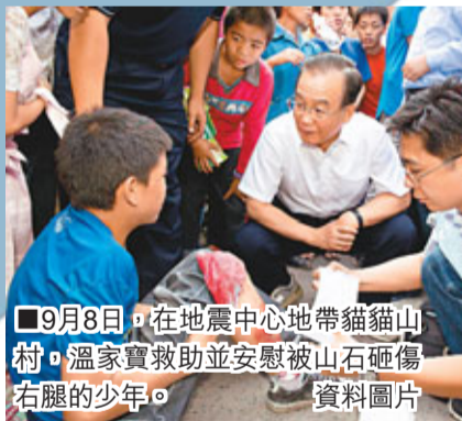
■9月8日，在地震中心地帶貓貓山村，溫家寶總理並安慰被山石砸傷右腿的少年。

祝福，現場熱鬧非凡。新郎小翁告訴記者，他和新娘從小認識，可以說是青梅竹馬，前不久新娘才從國外唸書回來，雙方原定在國慶節前舉行婚禮，因為地震把婚期推遲到了國慶節後。新娘丹霞說，地震給生活造成一定影響，現在災情過去了，生活還是繼續，婚禮上她是最幸福的人，希望他們的婚禮能給災區添喜。