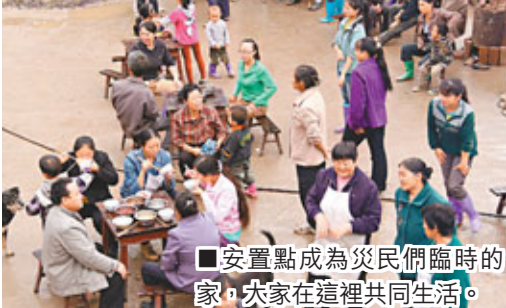
■安置點成為災民們臨時的家，大家在這裡共同生活。