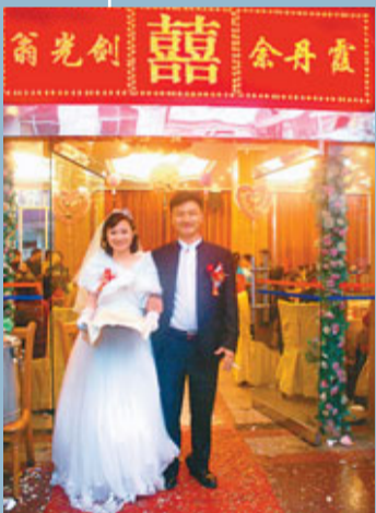
■10月4日，一對新人在彝良舉行婚禮，他們的願望是婚禮能給縣城多添點喜氣。