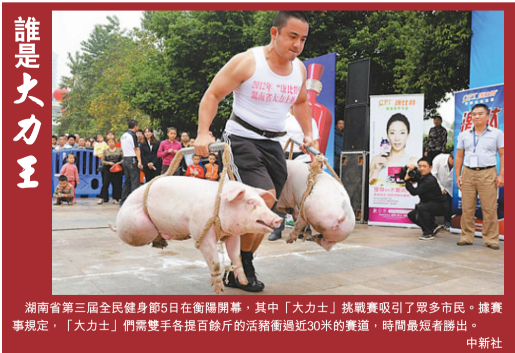
湖南省第三屆全民健身節5日在衡陽開幕，其中「大力士」挑戰賽吸引了眾多市民。據賽事規定，「大力士」們需雙手各提百餘斤的活豬衝過近30米的賽道，時間最長者勝出。

「婚禮」當天的程序是按眼下最流行的方式設計的，迎親、婚車巡街、拍外景、到酒店辦婚慶典禮，一樣都不少。在喜慶的氣氛中，兩位老人格外欣慰、激動。