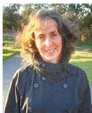
南目目前在三藩市灣區當畫家。

在喬布斯逝世一周年前夕，美國麥克米倫出版社日前宣布，獲得喬布斯高中女友兼私生女莉薩母親布倫撰写的回憶錄版權。