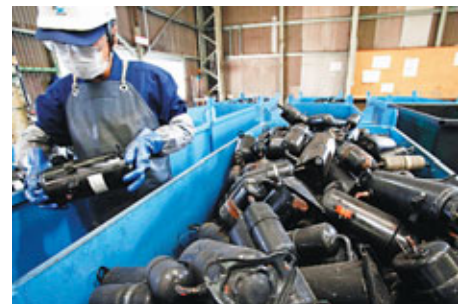
■日本的電子工業極依賴稀土。圖為日本工廠研究將稀土金屬循環再用。

中國商務部國際貿易合作學院研究員金柏松表示，中國在過去兩年對日本國債的持有量增加4.2倍，在2010年更超過美國和英國，成為日本國債的最大持有者。他認為，中國不排除會利用其2,300億美元的日本國債，以日本最大債權人身份對日本進行官方經濟制裁，令日本的財政陷入危機。其中最有效的方式是通過大規模賣出日本國債，引發其他債權人接連恐慌性拋售，最終因無人接盤而導致日本的金融市場崩潰。