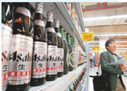
■中國的日本啤酒銷量受到反日浪潮影響而下降。

有國際關係專家說，中國一直嚴重依賴日本的投資資金和技術，而且日本是中國第三大出口市場，僅次於美國和歐盟。有人比喻說，這40年的中日經貿合作，讓雙方的經濟就像一棵樹，一旦被砍成兩半，雙方會受害。