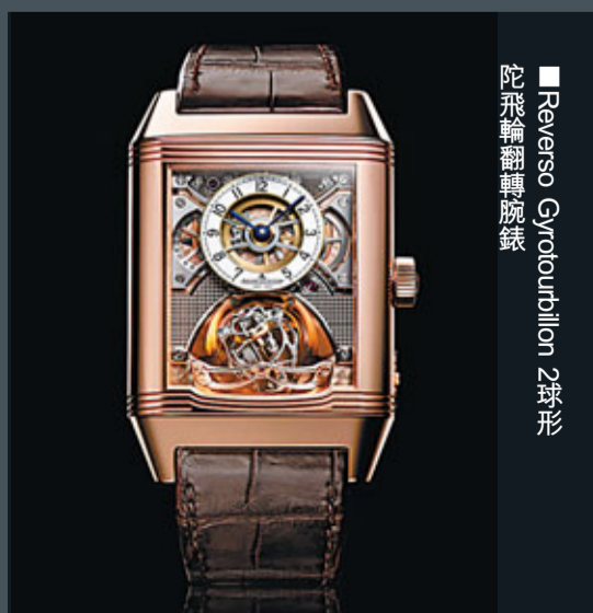
■Reverso Gyrotonnion 2款形陀飛輪翻轉腕錶

擁有179年歷史的瑞士頂級製錶品牌積家，於2011年11月香港1881專門店揭幕儀式上，正式啟動Proto Zero慈善計劃，把積家的「Proto Zero」腕錶——品牌最膾炙人口的限量腕錶原裝，亦即每個腕錶型號的首枚問世作品運到香港，於1881專門店獨家發售，並捐出錶價的10%予護苗基金，支持該會保護18歲以下兒童及青少年避免遭受性侵犯的慈善工