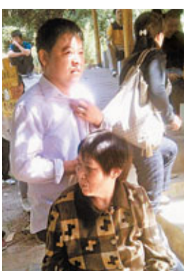
孝子背累了，和母親在途中休息。

湖北陽新縣仙島湖一個孝子，前天帶着其61歲半身癱瘓的母親到野人山遊玩，背着母親一步一步爬山，渾身是汗。一般人20分鐘的路程，他走了整整1個小時。這一情景讓人非常感動。