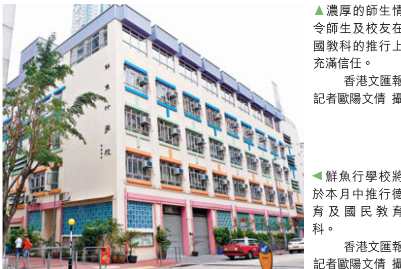
▲鮮魚行學校將於本月中推行德育及國民教育科。