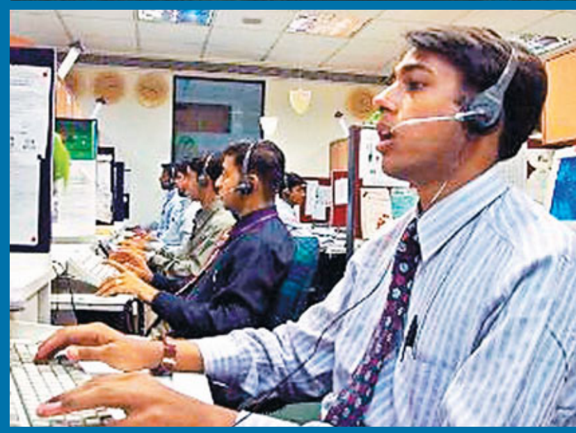
■亞開行倡議亞洲將服務業現代化。圖為印度電訊服務業。