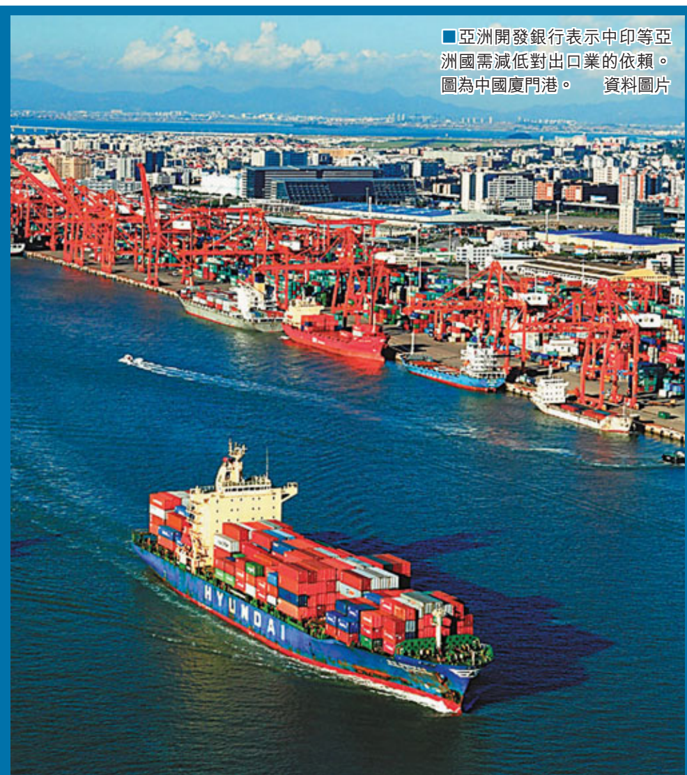
■亞洲開發銀行表示中印等亞洲國需減低對出口業的依賴。圖為中國廈門港。